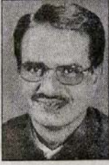
शिवराज सिंह चौहान का टवीट

योग एक सम्पूर्ण विज्ञान है। विश्व को यह भारत की अनमोल देन है। योग का अर्थ है जोड़ना, सामंजस्य