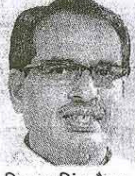
शिवराज सिंह चौहान

लगातार विजय से जिम्मेदारियाँ और उन्हें पूरा करने की चुनौतियाँ भी बढ़ जाती हैं। दिसम्बर 2013 में जब तीसरी बार जीतकर मैं मुख्यमंत्री बना, तो मेरे साथ भी ऐसा हुआ। 6 माह के पश्चात नरेन्द्र मोदी के नेतृत्व से केन्द्र में हमारी सरकार बनी। उनकी सोच, दिशा और गतिशीलता के अनुरूप प्रदेश के विकास और कल्याणकारी योजनाओं को क्रियान्वित करना और भी बड़ी चुनौती बन गई। प्रदेश में बिजली, पानी और सड़क के क्षेत्र में पर्याप्त सुधार के बाद हमने मध्यप्रदेश को आधुनिक बनाने की ओर विशेष ध्यान दिया है।